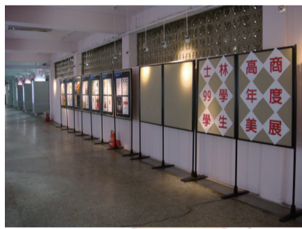
士商十景—晴光走廊

幽暗的倉庫重生了， 化身為合作社旁一條安靜的長廊。 一廊晴光，牆上學生無限的創意與巧思， 迎接著每日來來去去的士商人。 放學後，這裡更是士商人盡情揮灑青春的舞臺。 種種的練習與表演， 都在這長廊中不斷不斷的上演著……。