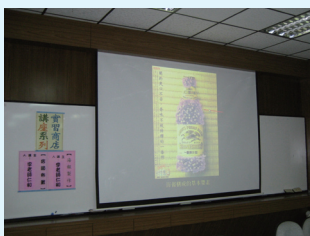
海報店面設計講座