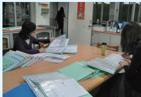
教師評閱各項資料

各班必需在商號籌畫過程中完成各項申請辦理作業，並經過審核評比，評比符合標準才能繼續進行商號營業。此外，各項作業階段更設立競賽及獎勵制度，期使各班級能努力爭取佳績，培養團隊精神。在這樣的歷程中學習，讓士林高商畢業學生無論在專業及待人處事能力，更甚而在未來工作職場上，都能有更輝煌的成就。