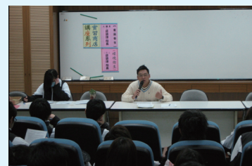
食品環境衛生講座