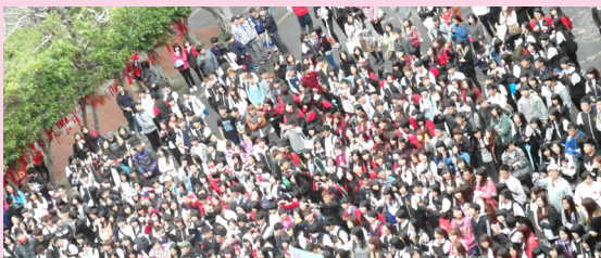
社聯協助提供社團表演，吸引人潮。