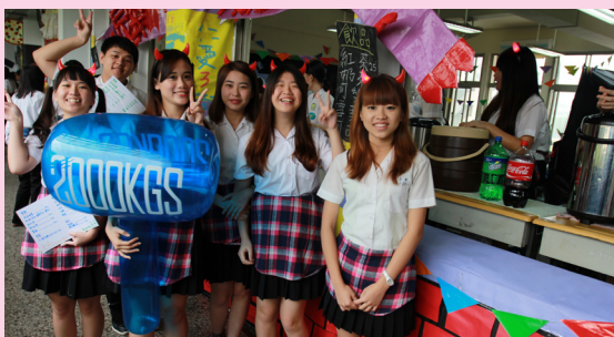
自製店服是商業季的一大特色。