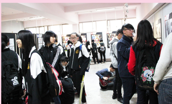
商業季結合廣設科美展，更添風采。