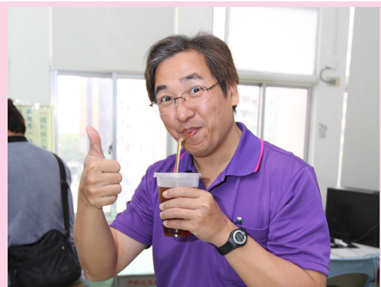
商業季敲鑼開賣囉！

就學生而言，士商四月天商業季過程中，學生展現的專業與熱情，正是青春賦予人類最大的資產。期許同學們在商業季中豐富精彩的成長與學習後，更進一步思考自己的未來與「如何成為我想成為的人」。設定目標，找對方法，全力以赴，為自己的青春譜出動人的旋律！