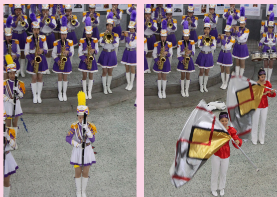
本校樂儀旗隊於商業季精彩演出。