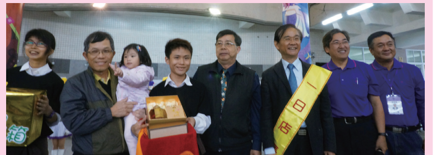
商業季義賣局長與家長會盧會長及得主合影