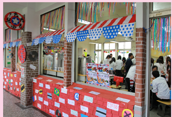
店面的裝潢，展現商店主題，讓消費者能融入其中，品嚐美食時更能有賞心悅目的風景。