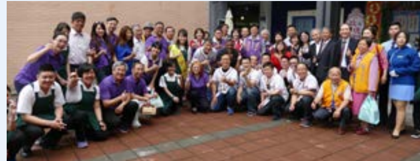
家長會號召各方師長共襄207班義賣盛舉

每年商業季，綜職科同學都會在地中海餐廳舉辦義賣活動，由特教班二年級同學負責製作所有的義賣商品，除了可增加烘焙實習機會，所得款項也捐贈本校愛心便當專款，以做公益來呼應友善校園。感謝教育局副局長何雅娟擔任一日店長，以及愛心不落人後的綜職科師生，還有士商家長會、校友會、瑞士銀行壘球隊的共襄盛舉。