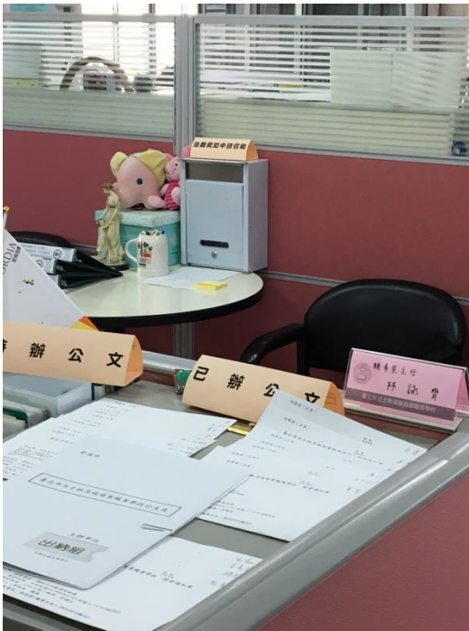
信箱於輔導主任位置前圓桌上