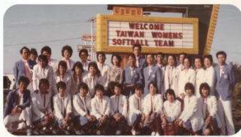
女壘隊在美國移地訓練(看板上寫歡迎台灣女子壘球隊)