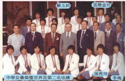
中華女壘隊獲世界盃第二名佳績