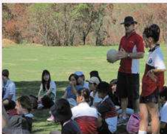
體育融合課~老師解說

時間一分一秒地過去，我們也培養出屬於我們溝通的默契，問他對土商的印象、來台灣的感想，他回答：「Taiwan had many tourist spot and delicious food and many cute girls. I go to Taiwan again without fail.」雖然他的文法並不是很正確，但還是看得出來他對台灣和土商的第一印象都很好！從初次見面，到最後離開前的拍照留念，時間無情的為短暫相處畫上了句點。但是日本友人到來的喜悅，溝通時的滑稽，離開前的感傷，這一點一滴，將永遠留存在我們心底！