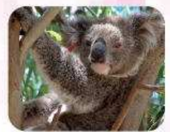
歡迎來澳洲找我唷~