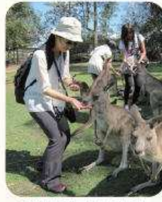
惠貞老師正在餵袋鼠