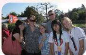
超級棒的homestay-依依不捨

在澳洲體驗學習的這段期間，讓我能深入感受到當地的民情風俗、生活習慣……雖然英文真的不夠好，但是澳洲人對外國學生很有耐心，只要有開口的勇氣、不要害羞，一樣可以溝通(真不行也還有秘密武器——「翻譯機」)。這次的參訪真的收穫很多，也交到很多的朋友，如果還有機會，我一定會再報名參加海外遊學，因為走出台灣，一切就很不一樣。