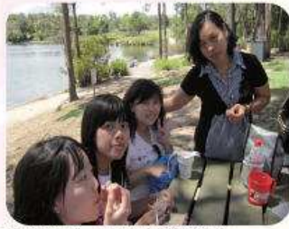
「校長媽咪」和我們共進午餐