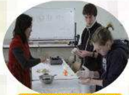
交換學生煮湯圓初體驗~~