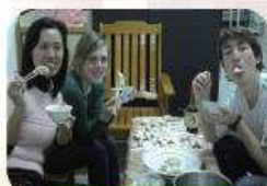
自己包的水餃超好吃