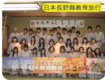
日本長野縣教育旅行

交換學生的個性都很獨立，對於自己的權益會很努力的去爭取，表達也比較直接，這一點跟我們東方人不太一樣，值得我們學習。交換學生帶給本校同學的不只是語言的學習刺激，也包括文化交流、美食交流、及風土民情介紹，更進一步提昇了同學的國際視野。