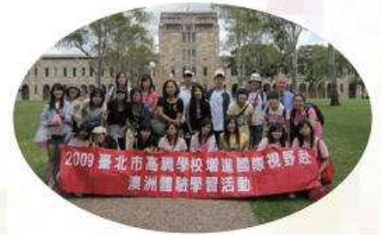
澳洲參訪團大合影