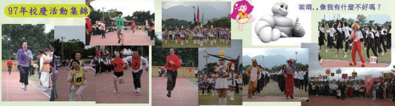
唉唷.. 像我有什麼不好嗎?