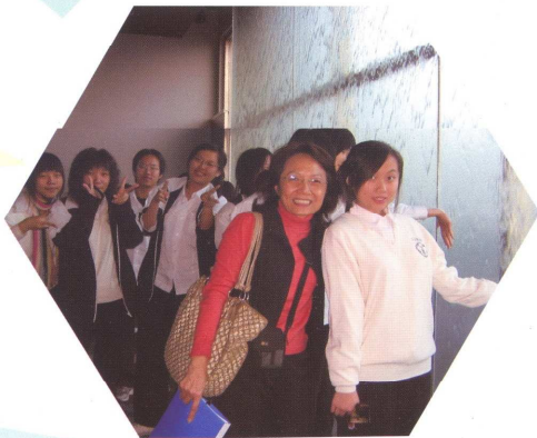
心澄社--校外參觀(永和世界宗教博物館)