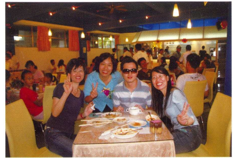
特教班同學地中海餐廳實習情形

民國五十九年，實習商店誕生啦！距今三十八年嘍～再過兩年，就要慶祝實習商店的「四十不惑」。當初舉辦實習商店的用意，是希望學生能夠在畢業前有實習商業流程的機會，替未來就業先做準備，並讓學生了解「取之於社會，用之於社會」的觀念，因此部份營收會捐給校內的急難救助金。也希望在準備與舉辦的過程中，能促進同學之間的默契、感情與溝通。這也是我們士商的「實習商店」有別於其他學校「園遊會」的地方，「實習商店」是「教學活動的展現」唷！所以在籌備與舉辦的期間，老師們都會在一旁指導與協助，學校也會提供場地與三大服務隊來維持秩序，社團則會邀請友校社團共襄盛舉，一起來同樂、表演。