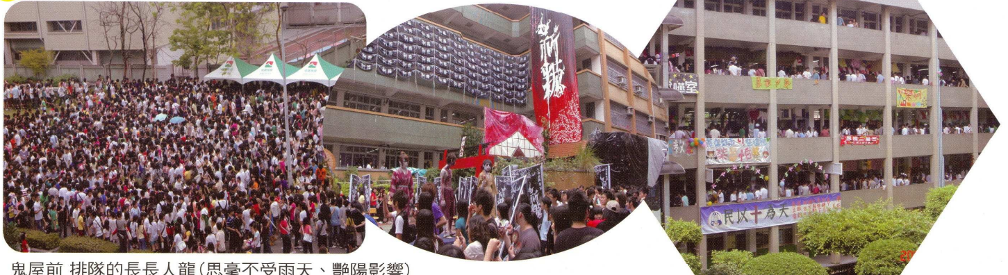
鬼屋前 排隊的長長人龍(思毫不受雨天、艷陽影響)

鬼屋的緣起 提到實習商店，當然不能少了最夯的鬼屋。最早期的實習商店，型態雖然五花八門，吃的喝的玩的樣樣不缺，還有許多特別的活動，如：跳蚤市場、網購……等意想不到的商店，但就是沒有鬼屋。直到民國七十四年，才由一群有創意的學長姐開始試辦鬼屋，一開始只有一間教室的大小，也不是在地下室裡舉辦，後來經廣設科同學發揮專長，規模才越來越盛大，驚悚指數也逐年飆高。現在，「鬼屋」已經是廣設科的招牌，更是實習商店中不可或缺的一環。所以，「士商鬼屋」可是有廿三年歷史的傳統老店唷！