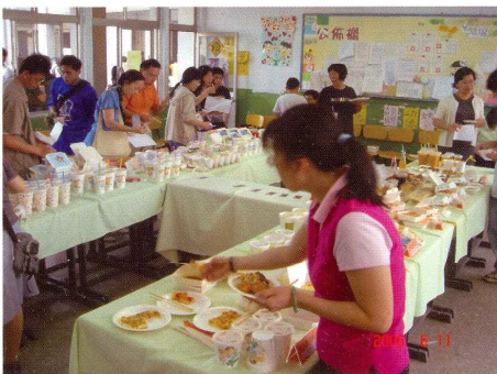
老師認真的評比各班餐點