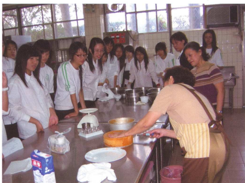
心澄社--讀書烘焙會