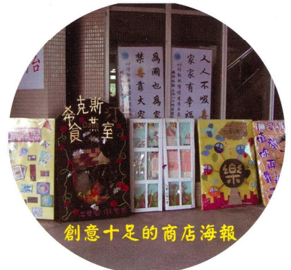
創意十足的商店海報

一開始，實習商店是與校慶結合在一起，並由日夜間部最高年級負責舉辦。但四技二專的增設與林立，提高了三(四)年級學生的升學意願。雖然，與校慶結合能吸引更多的人潮，準備時間也更為充分，但為了讓三(四)年級學生能更專心的準備升學，因此從九十五年開始將校慶與實習商店分開舉辦，並改由二(三)年級學生負責，讓學生的活動與壓力能平均分散在各年級裡，不會都擠在三(四)年級。