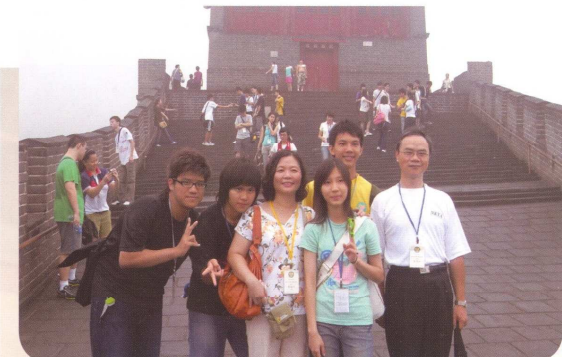
航天科技考察團參訪北京長城

來士商的這兩個月，我交到了很多朋友，還參加了衛生服務隊、班聯以及校刊社，我真的覺得幸好我來士商，士商真的好棒。