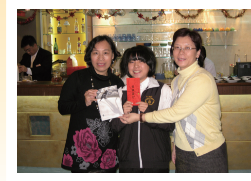
家長會長一起同樂並提供額外獎勵