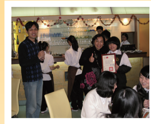
213全班於地中海餐廳與校長歡度下午茶