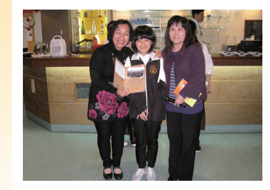
213導師淑慎老師及副班長贈感謝卡予校長