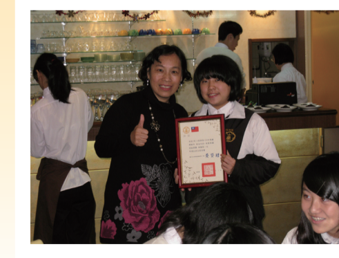
校長頒發「與校長有約」第一名獎狀(213班長代表領獎)