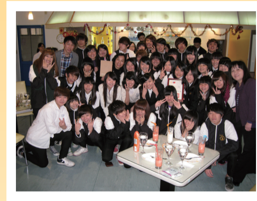
213全班於地中海餐廳與校長歡度下午茶