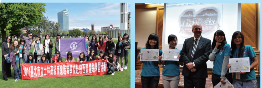
驗與一輩子的回憶！