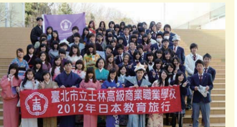
東邦高等學校參訪交流

最後一天到了名古屋城，而去年的滑雪教練也在那裡等我們，跟他邊逛邊說了很多話，他說他很喜歡這類的東西，不過時間不夠，不能夠好好的欣賞。之後他也跟我們一起到了雙子星大樓，跟他一起吃了飯，還一起觀光，很高興，之後就要啓程回國，這趟日本之旅真的是一個很珍貴的回憶，見到的每一個人、看到的每一項事物都好珍貴，希望那一天能夠再與那些人見面，希望這些回憶能夠永遠存在自己心裡。