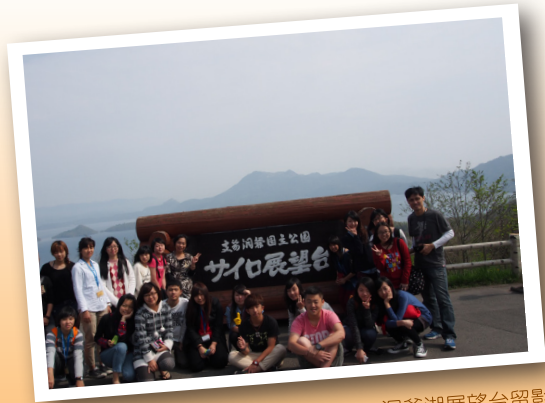
洞爺湖展望台留影