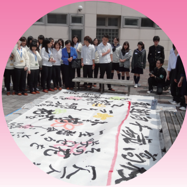
千歲高中學生表演書道