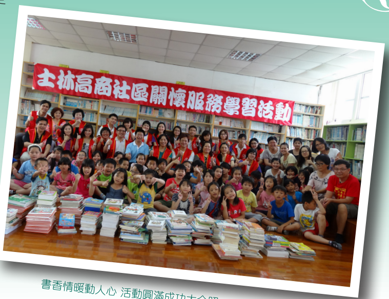
書香情暖動人心 活動圓滿成功大合照