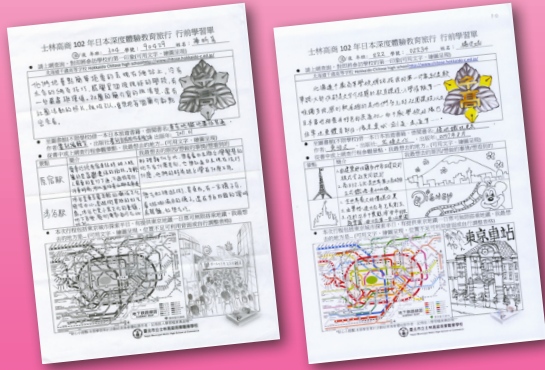
學生行前學習單節錄

本次教育旅行於102年5月26日至102年5月31日舉行，辦理日本教育旅行的目的是希望能帶給學生更多的文化衝擊，了解我們鄰近的國家--日本，因此、我們透過說明會，說明本次參訪的目的與意義，其次辦理日語教學等課程，並且給予學生行前學習單，期待在行前，學生能對此次參訪有初步的了解與參訪交流的方向。