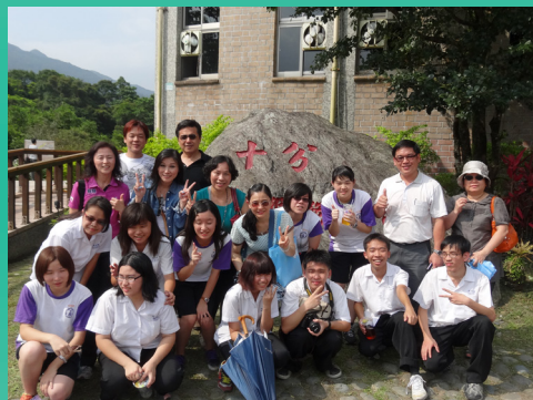
十分的太陽-熱情十分 快被熱情熔化的的士商一家人