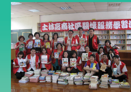
十大箱的好書，士商人滿滿的愛心 送給十分國小小朋友