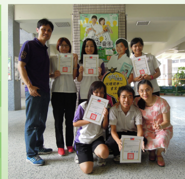
102學年度的士商閱讀代言人