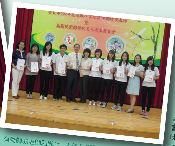
有愛閱的老師和學生 才有「卓閱」的士商