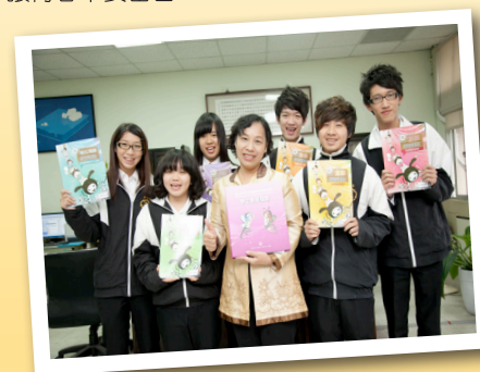
六藝俱全，快樂學習的士商人！

經過六藝教育的洗禮，士商人將擁有足夠的能量，去面對未來的人生挑戰。這本學習檔案將是士商人在士商所有學習的青華濃縮，對同學們將來的發展，有著重要的影響。同學們一定要把握這大好的學習機會，努力填滿屬於你自己客製化的學習檔案，逐夢踏實，彩繪人生，讓青春不要留白！