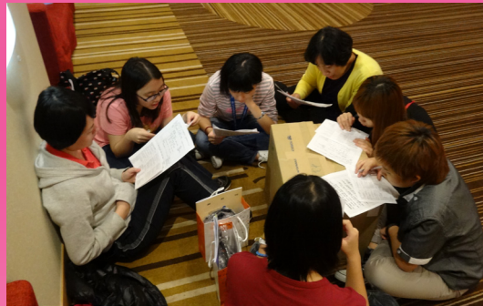
訪問千歲高中前一天為交流表演的夜間練習