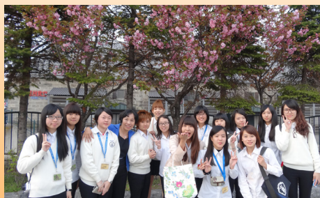
小樽街上盛開的櫻花

同學大開眼界，非常的溫馴可愛!最後的重頭戲是泡湯體驗!同學們一開始根本無法接受裸泡，讓同學們在更衣室猶豫了很久，直到學姊們灑脫的脫了，才給予同學勇氣進去!