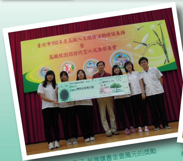
我們的努力被看見了 榮獲購書金壹萬元的獎勵