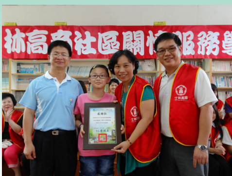
十分感謝--十分國小回贈士林高商感謝狀