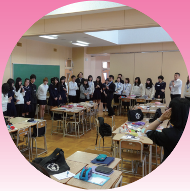
與千歲高中學生體驗學習