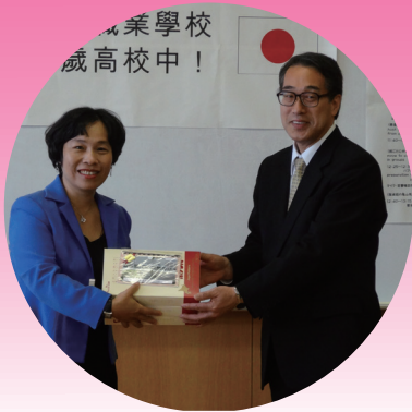
與千歲高中校長贈禮合照