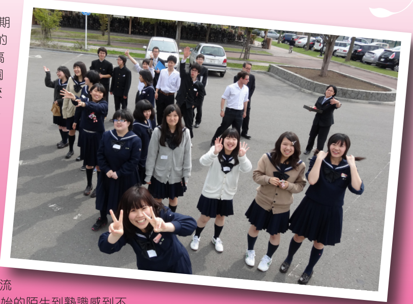
千歲高中學生依依不捨的道別

這次教育旅行最讓同學期待的就是去千歲高校與當地的學生做交流了。藉由訪問高校可深入了解日本高校校園環境現況，並增進日本高校教育文化了解，進而促進彼此交流。他們非常熱情的接待，歡迎式更讓同學體會到日本人做事的用心與周到。5月27日一早從飯店前往千歲高校。我們來到日本最主要的目的-千歲高校交流，或者期待而緊張的心情見面，我們與國際教養科的學生們一起上了課、與他們吃飯交談，還有交流表演、參觀校園等；從一開始的陌生到熟識感到不可思議，只透過了簡單的英文、日文甚至是肢體語言，就能深刻感受他們的熱情與真摯，同時也了解日本學生的校園生活。時間過得很快，同學都覺得還來不及跟該校學生深入交流就需離開了。在依依不捨下，只能說明年再見了。