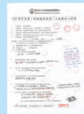
認真書寫的學習單