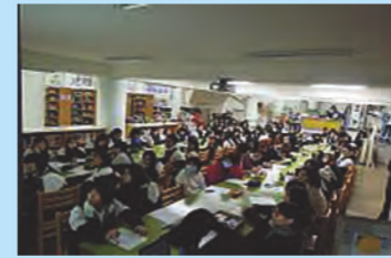
踴躍的參與人羣~我想要去日本