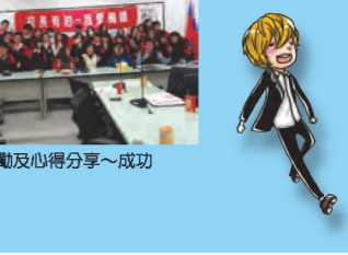
優勝獎勵及心得分享~成功