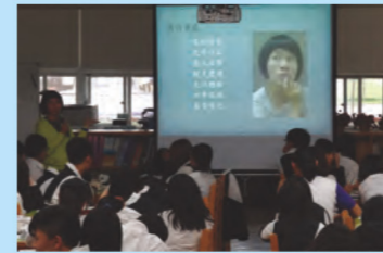
閱讀與寫作的經驗分享