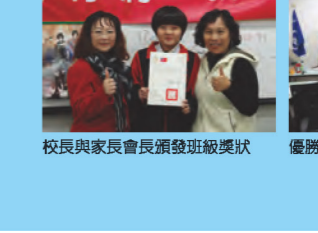
校長與家長會長頒發班級獎狀