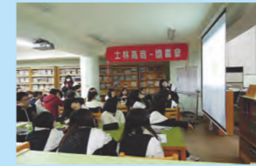
第 2 閱讀代言人 206 吳孟儒帶大家去旅行