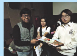
認真的老師抽中精美文具一份