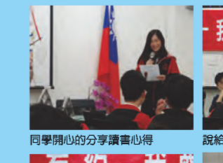
同學開心的分享讀書心得