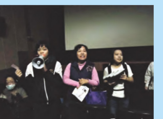
緊張的一刻~校長即將抽出幸運兒