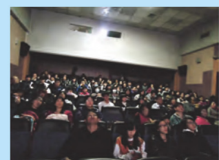
感謝士商人教職員工生熱情參與