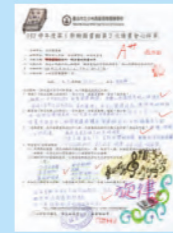
圖文並茂的學習單