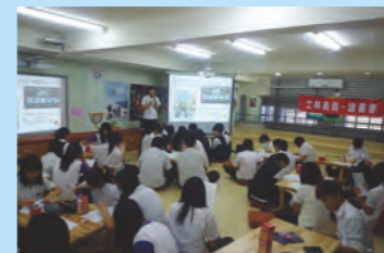
回答及分享的同學各獲得精美小禮物一份