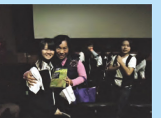
可愛的學生也抽中好書 1 本