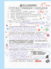
收穫滿滿的學習單