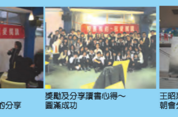
腦力激盪~同學與閱讀代言人的分享