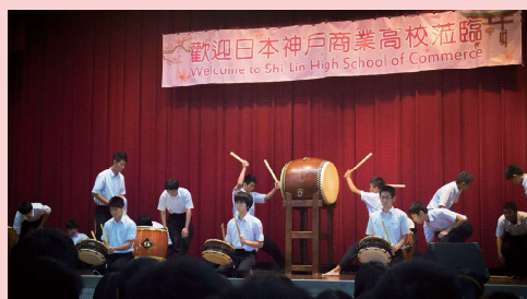
神戶高校太鼓表演▲