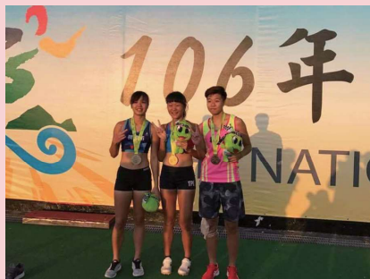
宜蘭全運會女子撐竿跳第一名 ▲