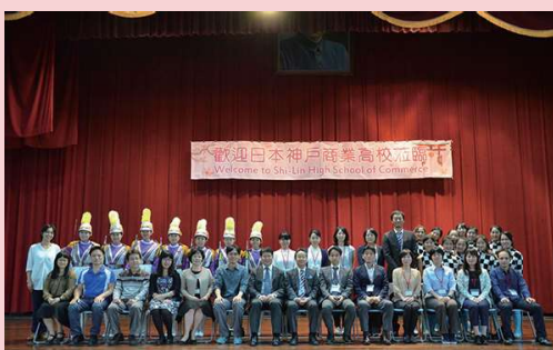
2017日本神戶商業高校蒞臨士林高商參訪留念合影