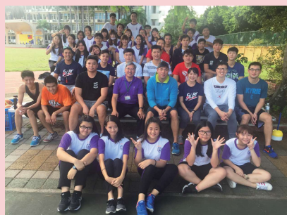
達欣虎隊和本校籃球隊友好交流 ▲