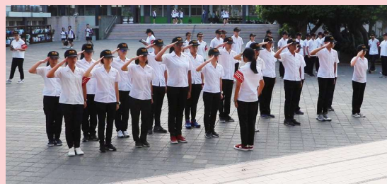
秩序服務隊交接合影▲

我想告訴一年級的學弟妹，不要因為訓練或執勤就否定秩序大隊這個大家庭，或許你會覺得早起很累、訓練很操勞、執勤很辛苦，又或者學長姐很嚴格，但我希望你們更能夠用心體會，這個家帶給你們的是溫暖、是愛，而我們這些高階幹部更希望能夠成為你們的支柱，在你們跌倒的時候，伸出援手，在你們開心難過的時候，會想起我們，願意跟我們分享，也許服務隊，不是你們高中生涯的全部，但是我們會把所有的愛，獻給每一個你們！