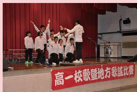
高一校歌暨地方歌謠比賽 (特教班) ▲