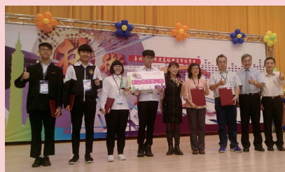
北市106年商業行銷技術獎第一名 ▲