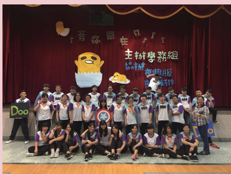
音樂觀摩賽冠軍-進101 ▲

音樂觀摩會，大家花了許多時間及心血；從剛開學的陌生面孔，到活潑熱血的進101，這一段路程上跌跌撞撞，但也因此讓我們更加團結，每一次的練習都當作最後一次，感謝學長姐的諄諄教誨，讓懵懂羞澀的我們成為一個同心圓，友誼也更加堅固，收穫良多。