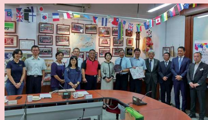
日本廣島吳商業職校國際交流 ▲