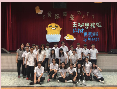
音樂觀摩賽亞軍-進105 ▲