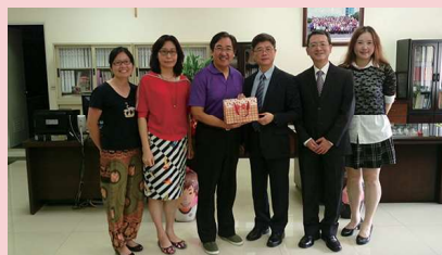
會計師公會蒞校交流惠我良多 ▲