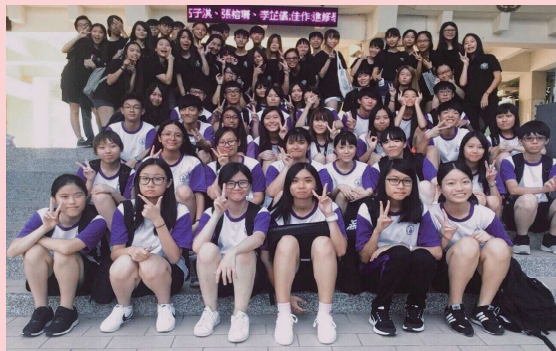
衛生服務隊幹部合影▲

從小隊員開始，兢兢業業經過校慶、實習商店兩大勤務，如今當上衛生勤務幹部，我覺得很光榮。我知道自己不能就此鬆懈，必須更加努力突破各種難關並提升自我能力。范瑋琪〈最初的夢想〉中說道，「最初的夢想緊握在手上，最想要去的地方，怎麼能在半路就返航」。堅持最初的夢想讓衛服越來越好。