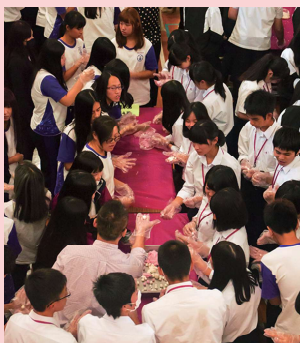
兩校師生體驗搓湯圓▲

本校的樂儀旗與日本的太鼓表演中，展現了各自的特色表演，充分感受到兩校間熱烈歡樂的氣氛。