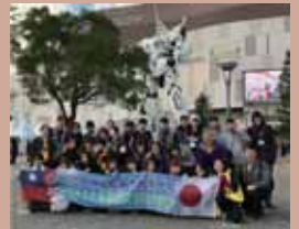
•士商日本教育旅行