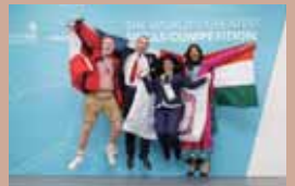
•士商廖羿婷榮獲國際技能