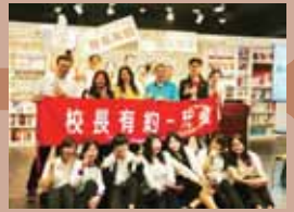
•我愛閱讀 校長有約