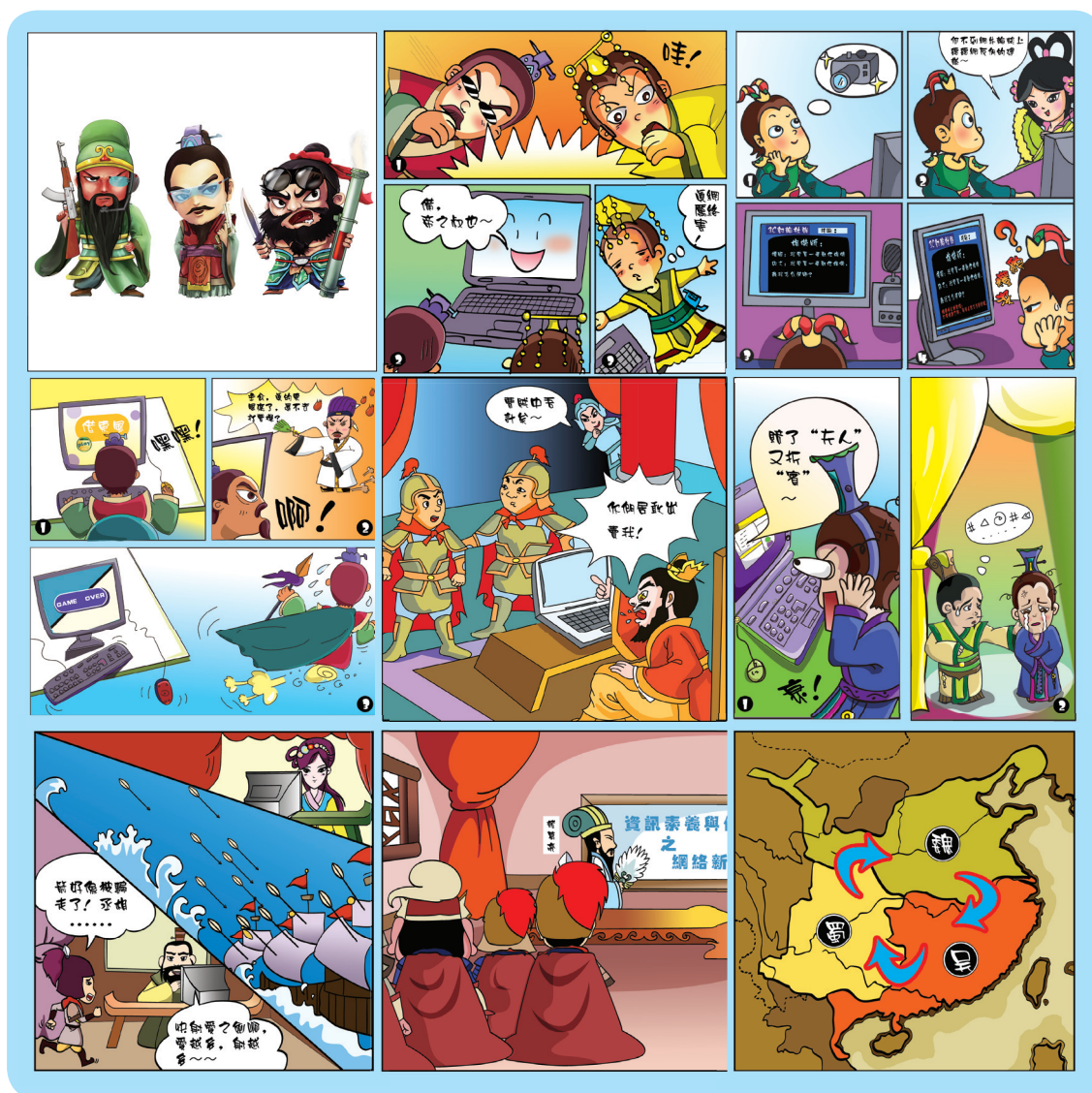
圖一 三國與資訊倫理聯想圖